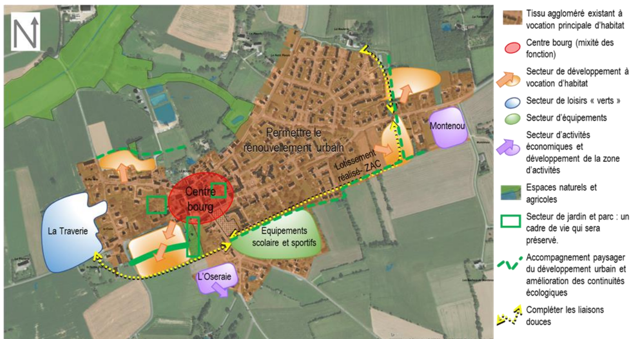
Illustration spatiale de la mise en œuvre du PADD – bourg de Domalain