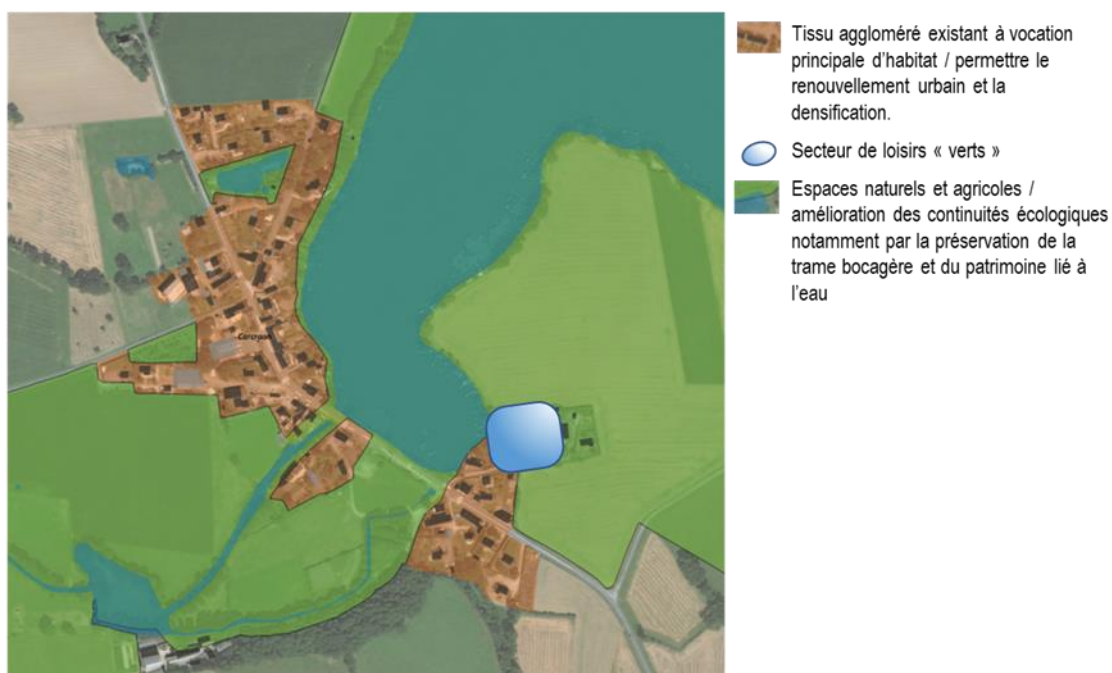
Illustration spatiale de la mise en œuvre du PADD – village de Carcraon

Prendre en compte la particularité historique du territoire de la commune de Domalain en reconnaissant le caractère spécifique du village de Carcraon et le caractère exceptionnel du hameau de la Heinrière qui représentent deux entités urbaines à part entière. Elles sont situées à l'écart de l'agglomération et possèdent leur identité propre. Le statut de chacune de ces entités urbaines sera conforté dans par la mise en place d'un zonage spécifique pour permettre le comblement de « dents creuses » à l'intérieur de leurs enveloppes urbaines.