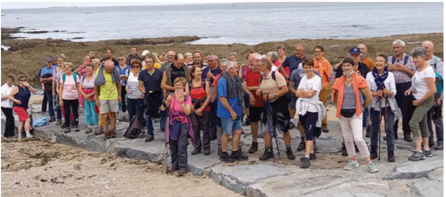
Le groupe Randomalain près de Quimiac en Loire-Atlantique