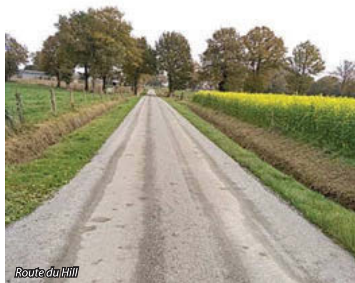
Route du Hill

Les Routes Départementales ne sont pas du ressort du Conseil Municipal de Domalain. Il arrive souvent que des doléances nous parviennent concernant ces voies de circulation. Nous ne pouvons que transmettre ces réclamations aux services concernés.