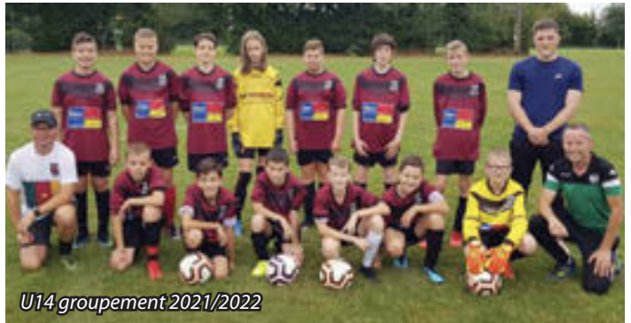
U14 groupement 2021/2022

Nous avons des équipes dans tous les niveaux