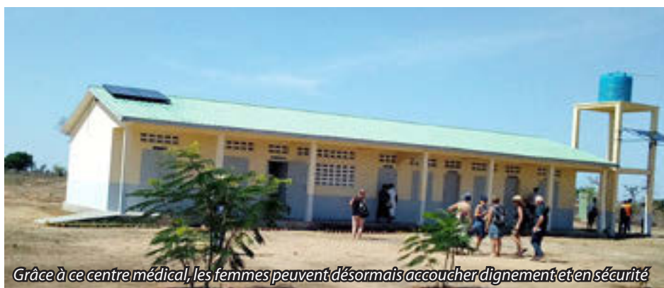
Grâce à ce centre médical, les femmes peuvent désormais accoucher dignement et en sécurité

Nous vous donnons rendez-vous pour notre prochaine Assemblée Générale le VENDREDI 25 FEVRIER 2022, Espace Culturel de Domalain.