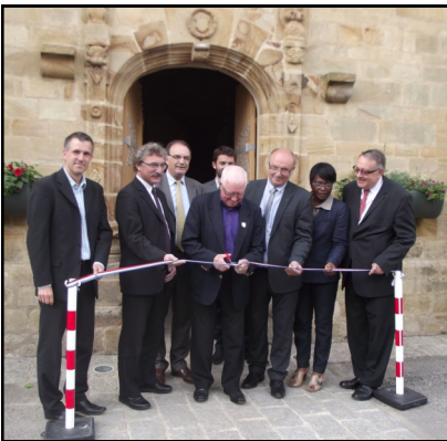
Inauguration de l'église du 30 mai