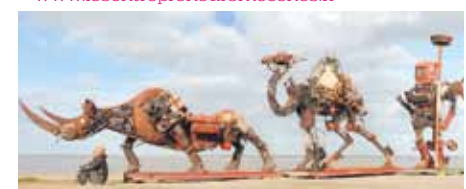
© Christian Champin - Tno Indignados