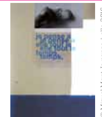
© Miquel Mont. Je pense à elle, 2016.