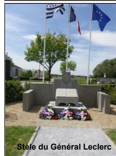
Stèle du Général Leclerc

Je vous souhaite, avec mon Équipe Municipale, de profiter de ces moments conviviaux et de passer de Bonnes Vacances.