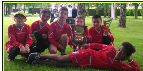
U11 au tournoi à Soudan

La journée commencera par une célébration à partir de 10h30 à l'église de Domalain, suivi de la photo de groupe. Repas au restaurant L'Espérance à Vitré et une soirée dansante à la salle polyvalente de Domalain ouverte à tous et gratuite. Prix par adulte 35 euros et par enfant 15 euros. Le prix comprend la célébration, gerbe de fleur, repas du midi et restauration du soir (sandwich). Réservation à Mon P'tit Bar et Votre Marché à Domalain. Fin des inscriptions le 15 Septembre.