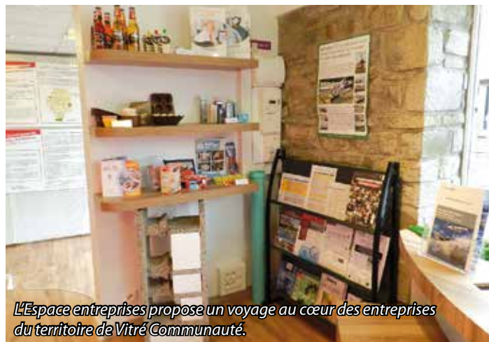
L'Espace entreprises propose un voyage au cœur des entreprises du territoire de Vitré Communauté.

secteurs d'activité qui permettent de se donner une vision globale des perspectives d'emploi et d'évolution dans l'industrie (technologie, cosmétique, agroalimentaire, imprimerie...) et les services à l'entreprise (logistique, recherche et développement, centre de relation clientèle...).