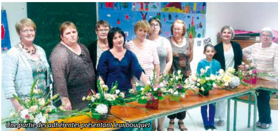
Une partie des adhérentes présentant leur bouquet

Chaque mois, un bouquet est proposé par notre animatrice. Ces compositions originales font l'admiration de ces mains vertes. Le but recherché est la mise en valeur des fleurs du jardin et les nombreux feuillages que l'on rencontre dans la nature et les haies arbustives. Les fleurs ne sont pas imposées. La bonne humeur et la fraternité priment durant les cours et l'échange de fleurs et de feuillage est de mise. Les cours durent de 1 h 30 à 2 heures et ont lieu un lundi soir par mois, à 20 h 15, Espace Culturel de Domalain.