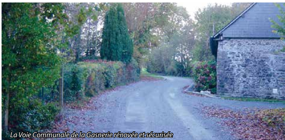
La Voie Communale de la Gasnerie rénovée et sécurisée