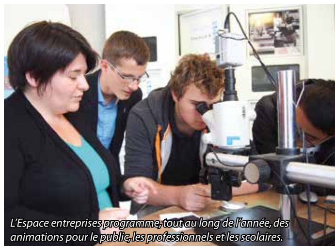
L'Espace entreprises programme, tout au long de l'année, des animations pour le public, les professionnels et les scolaires.

Allflex, AMI, API, Arenius, BCM Cosmétique, Chaudronnerie Orhand, Cooper, Cornillé, Design Parquet, Eurimex Pharma, FAO, Gatine