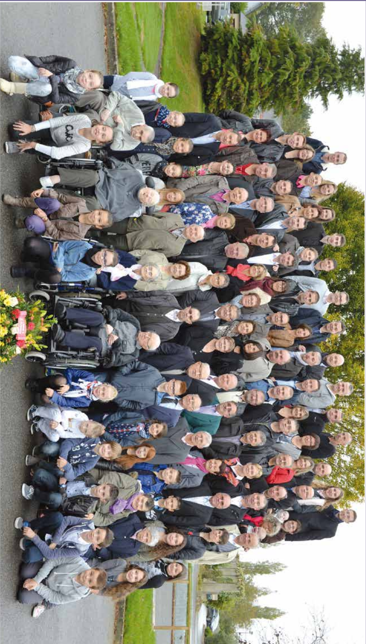
Classes de Dowalain 2014